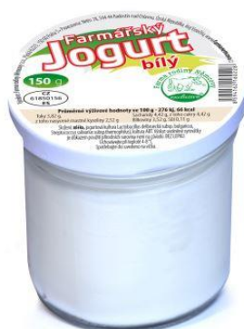
Obrázek 8 - Farmářský jogurt z farmy