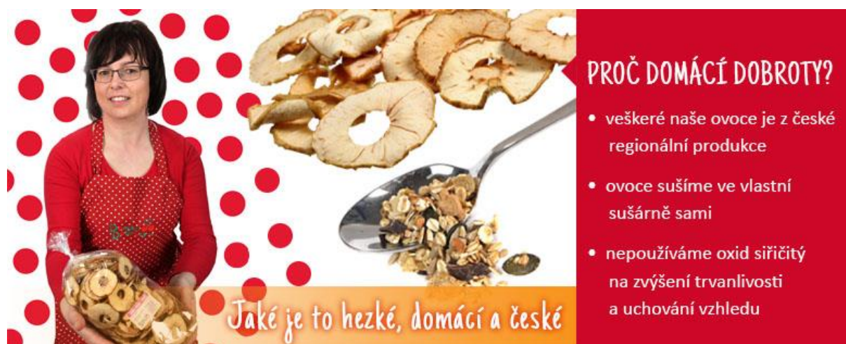
Obrázek 18 - Domáci dobroty s.r.o.