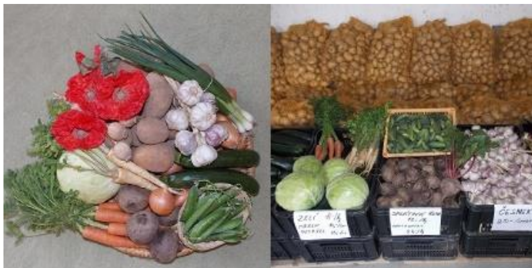
Obrázek 19 - Ukázka zeleniny