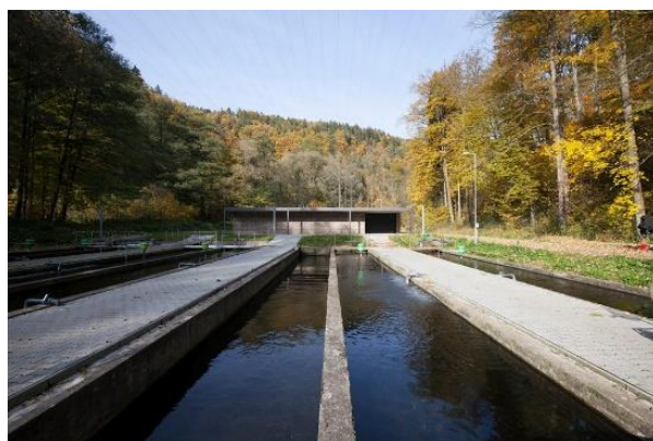
Obrázek 6- Ukázka rybárny