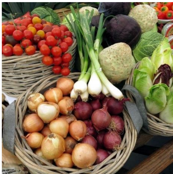
Obrázek 2 - Ukázka zeleniny