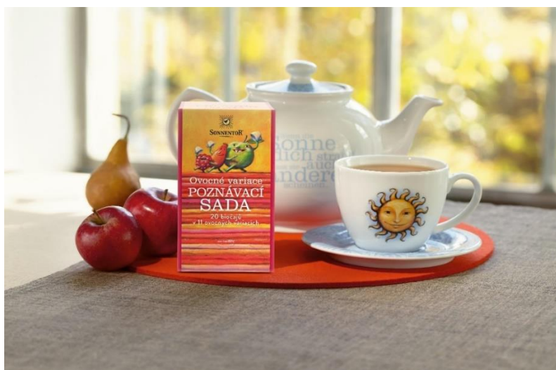
Obrázek 24 - Ukázka sady ovocných čajů