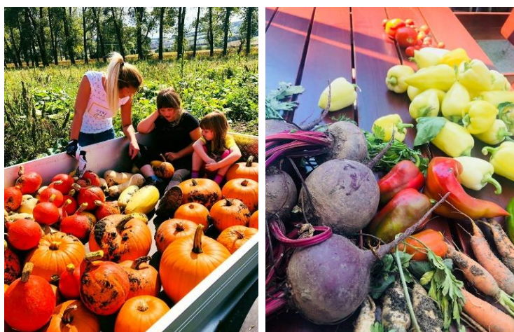
Obrázek 3 - Ukázka zeleniny