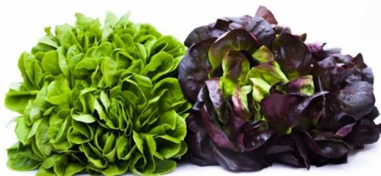
Obrázek 12 - Ukázka salátů