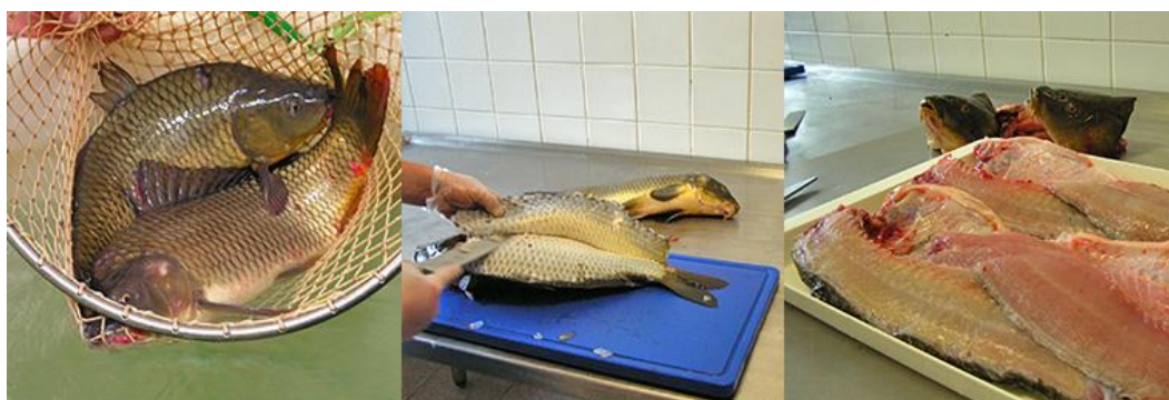
Obrázek 7- Ukázka ryb