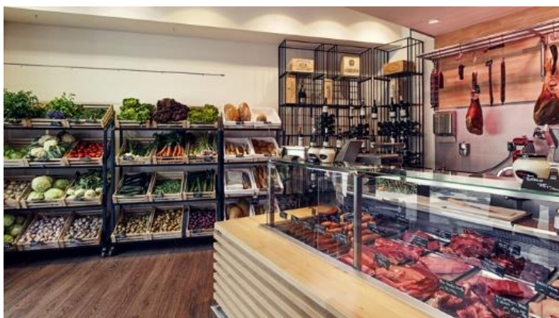
Obrázek 4- Ukázka Brněnské prodejny