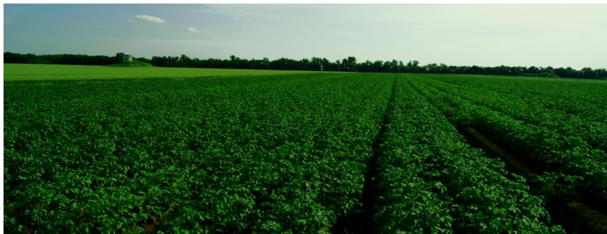
Obrázek 13 - Pole na farmě