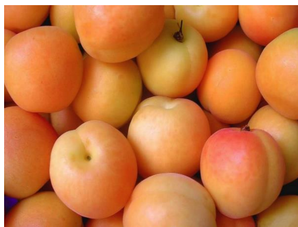
Obrázek 11 - Ukázka ovoce a zeleniny z farmy