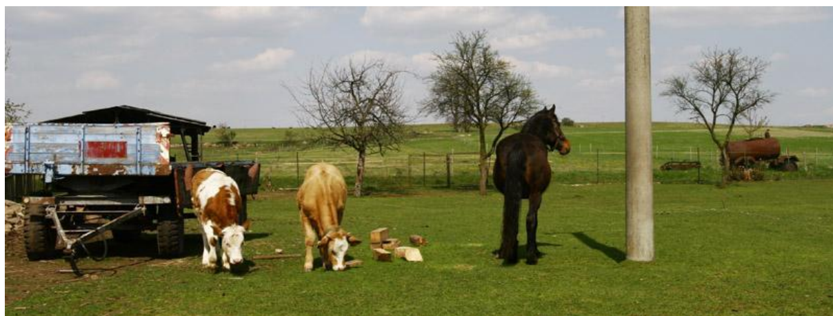
Obrázek 15 - Farma