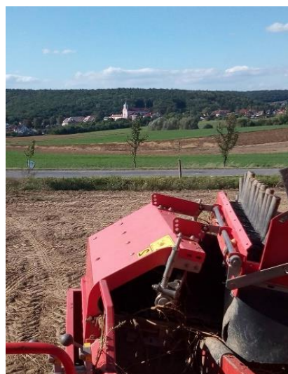
Obrázek 16 - Sklizeň brambor