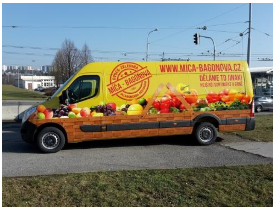
Obrázek 17 - Rozvozné auto