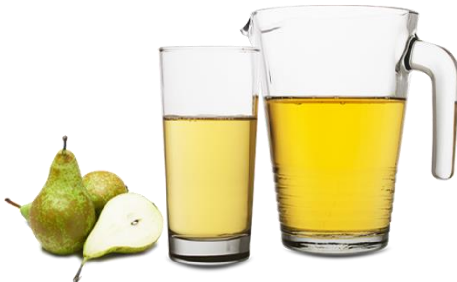
Obrázek 23 - Ukázka 100% hruškového koncentrátu