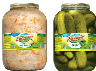
Obrázek 22 - Ukázka produktů