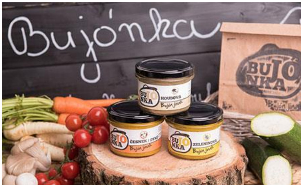
Obrázek 21 - Ukázka produktů