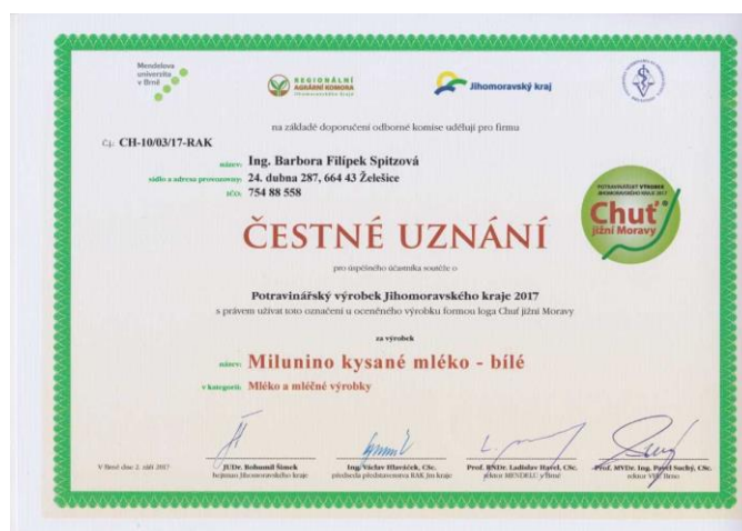
Obrázek 9 - Ocenění farmy ( http://www.umlsnekozy.cz/2018/01/19/zlata-chut-jizni-moravy-2017/ )