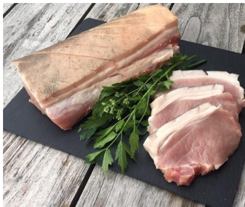
Obrázek 1 - Ukázka produktů