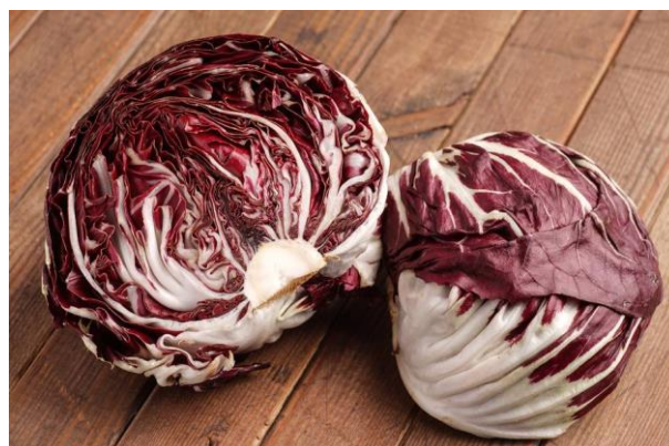
Obrázek 14 - Ukázka zeleniny