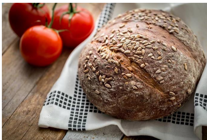
Obrázek 20 - Špaldový chléb