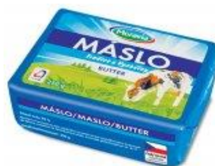
Obrázek 10 - Ukázka produktů